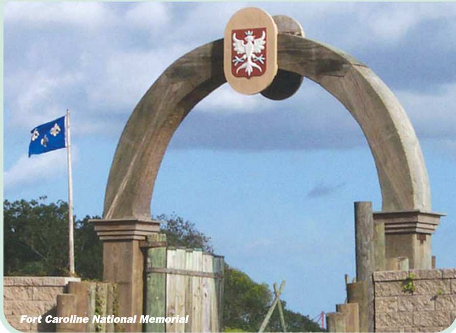
Fort Caroline National Memorial