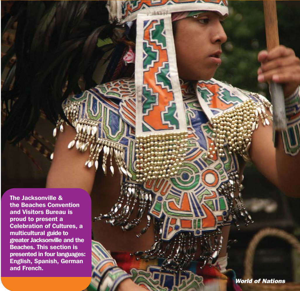
World of Nations

The Jacksonville & the Beaches Convention and Visitors Bureau is proud to present a Celebration of Cultures, a multicultural guide to greater Jacksonville and the Beaches. This section is presented in four languages: English, Spanish, German and French.